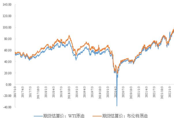
图1：国际原油价格走势情况（美元/桶）

产品价格受原油价格影响亦大幅上升，而接近消费端的化工品的价格更取决于自身的供需变化。