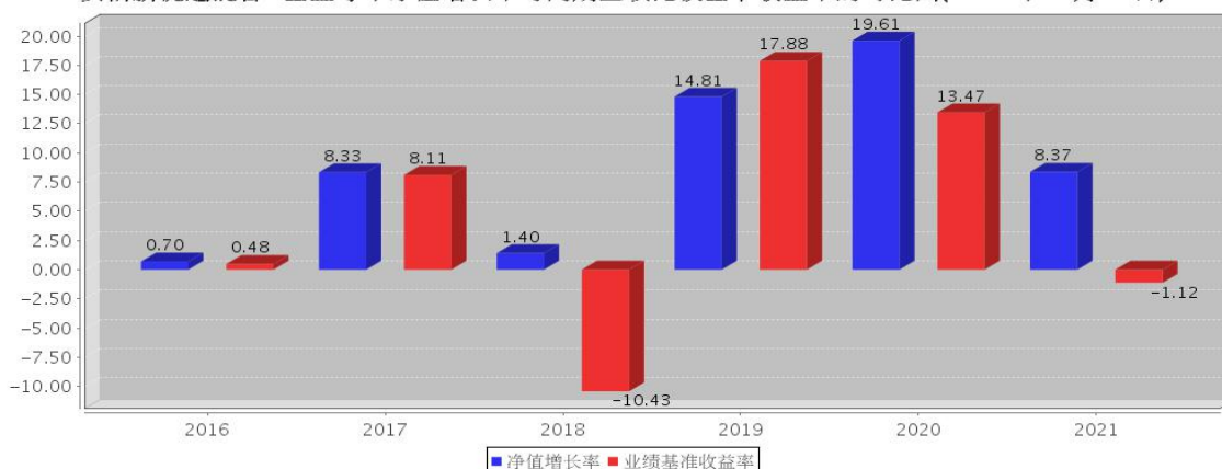
安信新优选混合A基金每年净值增长率与同期业绩比较基准收益率的对比图(2021年12月31日)

注: 基金合同生效当年期间的相关数据按实际存续期计算。基金的过往业绩并不代表其未来表现。