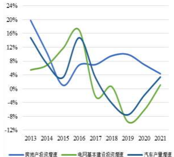
图 2：近年来我国铝下游增速情况

从消费结构看，铝下游应用广泛，其中建筑地产、交通运输及电子电力行业对铝需求规模较大。建筑地产行业方面，2021年以来我国房企加快项目结转带动竣工面积高速增长，全年全国房地产开发企业房屋竣工面积同比增长 11.20%至 101,412 万平方米，对铝消费有一定拉动作用；但长期来看，房企在“三道红线”压力下拿地趋于谨慎，加之融资持续趋紧，房地产行业投资增速将面临下行压力，未来行业用铝将受到一定影响。汽车制造是交通运输行业中用铝的主要细分领域之一；2021年我国汽车产量同比增长 3.40%至 2,608.20 万辆，其中新能源汽车产量为 354.5 万辆，同比增长 1.6 倍；未来，新能源汽车产量放量及单车铝消耗量的提升等将带来铝需求新增量。电力行业方面，2021年我国电网基本建设投资完成额同比增长 1.10%；未来特高压项目的推进及光伏装机增长将成为电力行业用铝主要增长点。整体来看，铝需求较为分散，相对不容易出现需求与宏观周期的错配，2021年我国电解铝消费量同比增长 5.74%至 4,055 万吨；未来铝在新能源汽车轻量化、特高压新基建以及其他新兴领域应用的扩展均可对其需求形成良好补充，但短期内需关注铝价持续高位运行可能对需求产生的影响。