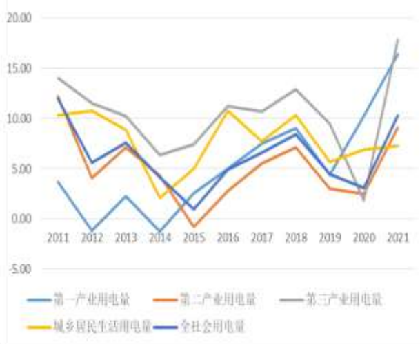
图6：近年来中国分产业电力消费增速（%）

电力行业的发展与宏观经济走势息息相关，根据中国电力企业联合会（以下简称“中电联”）数据，我国用电增速在经过2008年四万亿的投资拉动到达2010年高点后开始波动下行，并于2015年降至近年冰点。进入2016年以后，受实体经济增速波动、夏季高温天气和电能替代等因素综合影响，我国全社会用电量增速呈先扬后抑波动态势。2021年以来，在疫情反复、北方汛情、电煤供应紧张、海外制造业疲软带来的出口替代效应及2020年低基数等因素的综合影响下，我国全社会用电量同比增长10.30%，保持较好水平，但随着国家经济下行压力的增加以及“碳达峰、碳中和”政策的实施，或将对全国用电需求的增长造成较大抑制。