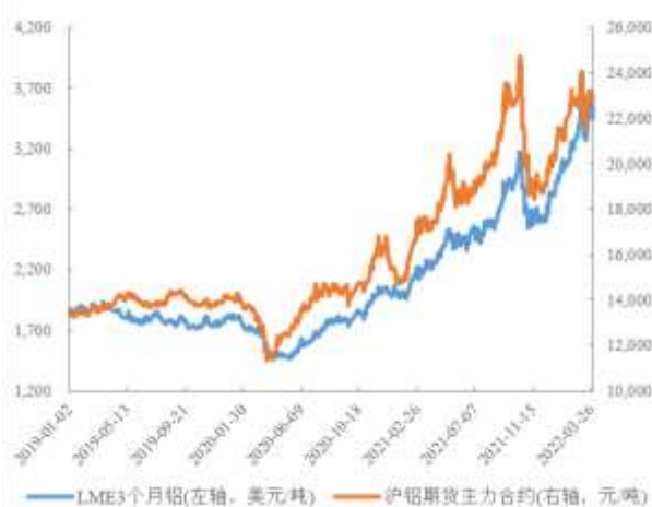
图 3：近年来 LME3 月期铝和沪铝主力合约价格走势

2022年一季度，欧洲能源危机、俄乌冲突升级等加剧了海外对原铝供应的担忧，推升伦铝价格大幅上涨，LME三月期铝最高涨至4,073.5美元/吨，创历史新高；2022年3月，LME三月期铝均价为3,520美元/吨，环比上涨9.30%。国内方面，受多地疫情频发影响，下游需求较弱，沪铝涨势逊于外盘；2022年3月，SHFE三月期铝均价为22,741元/吨，环比上涨0.40%。