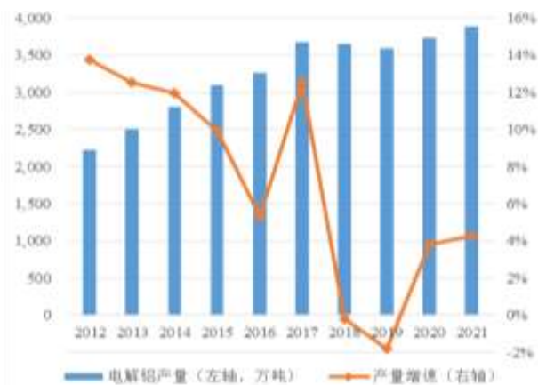
图 1：近年来我国电解铝产量及增速情况

产量方面，在上年同期疫情影响基本消除的情况下，自2021年1月以来电解铝月度产量显著高于上年同月水平；但能耗双控及限电限产对电解铝生产的影响从第三季度起逐步显现，11月月度产量已低于去年同月水平；整体来看，2021年我国电解铝产量同比增长4.29%至3,890万吨，产量不及预期。生产成本方面，氧化铝及电力成本在电解铝生产成本中占比达70%以上；2021年原燃料价格上涨使得电解铝生产成本持续增长，并于11月份突破20,000元/吨；但全年来看，由于铝价涨幅超过成本涨幅，电解铝行业整体仍实现较好盈利。 中诚信国际关注到 ，在“碳达峰”、“碳中和”的政策背景之下，电解铝行业产能扩张或面临更多政策阻力，生产经营亦面临成本上涨、能源结构有待改善等挑战，需持续关注行业政策变化及开工率变化等对供给端产生的影响。