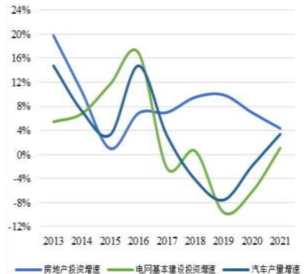
图 2：近年来我国铝下游增速情况

建筑地产行业方面，2021年以来我国房企加快项目结转带动竣工面积高速增长，全年全国房地产开发企业房屋竣工面积同比增长 11.20%至 101,412 万平方米，对铝消费有一定拉动作用；但长期来看，房企在“三道红线”压力下拿地趋于谨慎，加之融资持续趋紧，房地产行业投资增速将面临下行压力，未来行业用铝将受到一定影响。汽车制造是交通运输行业中用铝的主要细分领域之一；2021年我国汽车产量同比增长 3.40%至 2,608.20 万辆，其中新能源汽车产量为 354.5 万辆，同比增长 1.6 倍；未来，新能源汽车产量放量及单车铝消耗量的提升等将带来铝需求新增量。电力行业方面，2021年我国电网基本建设投资完成额同比增长 1.10%；未来特高压项目的推进及光伏装机增长将成为电力行业用铝主要增长点。整体来看，铝需求较为分散，相对不容易出现需求与宏观周期的错配，2021年我国电解铝消费量同比增长 5.74%至 4,055 万吨；未来铝在新能源汽车轻量化、特高压新基建以及其他新兴领域应用的扩展均可对其需求形成良好补充，但短期内需关注铝价持续高位运行可能对需求产生的影响。