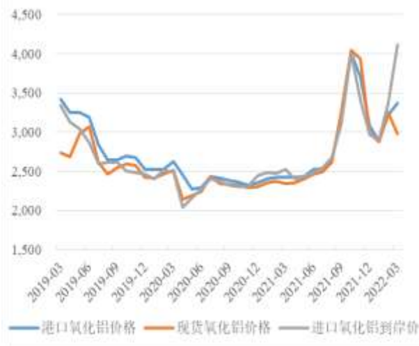
图5：近年来国内氧化铝现货价格走势（元/吨）

从成本构成来看，氧化铝成本主要包括矿石成本、能源成本和烧碱成本等。国内氧化铝企业对进口铝土矿的依赖程度较大，铝土矿60%需进口，进口矿石主要来自几内亚、澳大利亚及印尼等地；2021年我国铝土矿进口量为10,741万吨，受运费上涨影响同比减少3.70%。同期烧碱和煤炭价格则经历冲高回落的过程，但价格尚难以回落至原位，氧化铝成本重心整体有所上移。