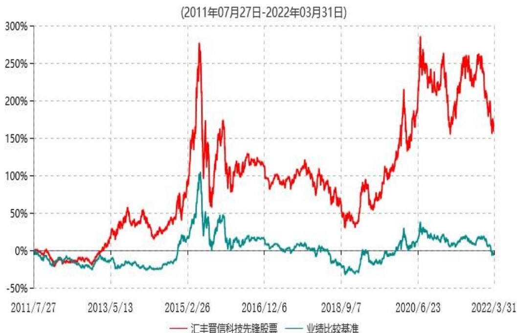
汇丰晋信科技先锋股票型证券投资基金累计净值增长率与业绩比较基准收益率历史走势对比图