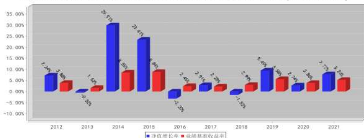
泰达宏利集利债券C基金每年净值增长率与同期业绩比较基准收益率的对比图(2021年12月31日)