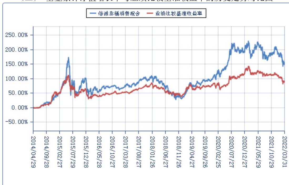
(二) 基金累计净值增长率与业绩比较基准收益率的历史走势对比图