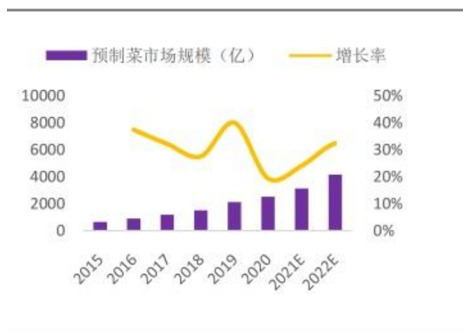
我国预制菜行业规模增长情况

根据中国消费者报数据显示，我国预制菜行业市场规模从2017年的约1,000亿元快速增长至2020年的约2,600亿元，平均年复合增速高达37.51%。