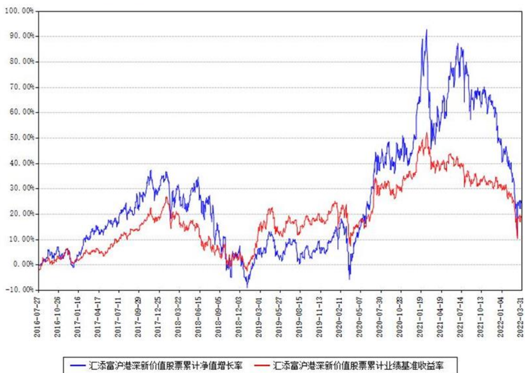
汇添富沪港深新价值股票累计净值增长率与同期业绩基准收益率对比图