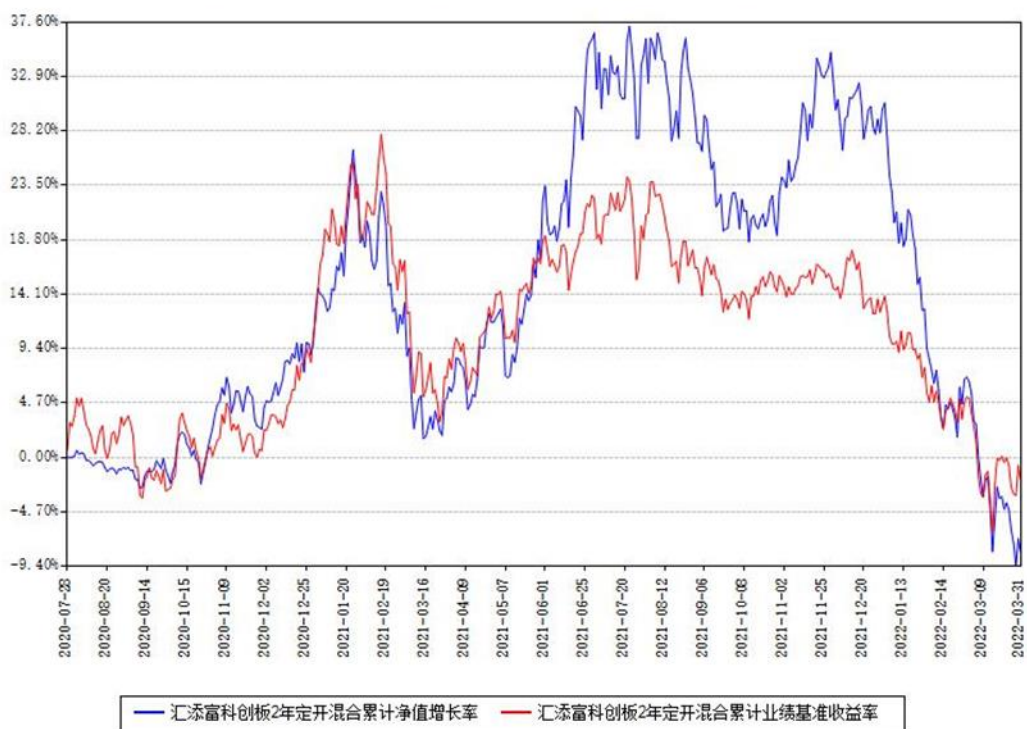
汇添富科创板2年定开混合累计净值增长率与同期业绩基准收益率对比图