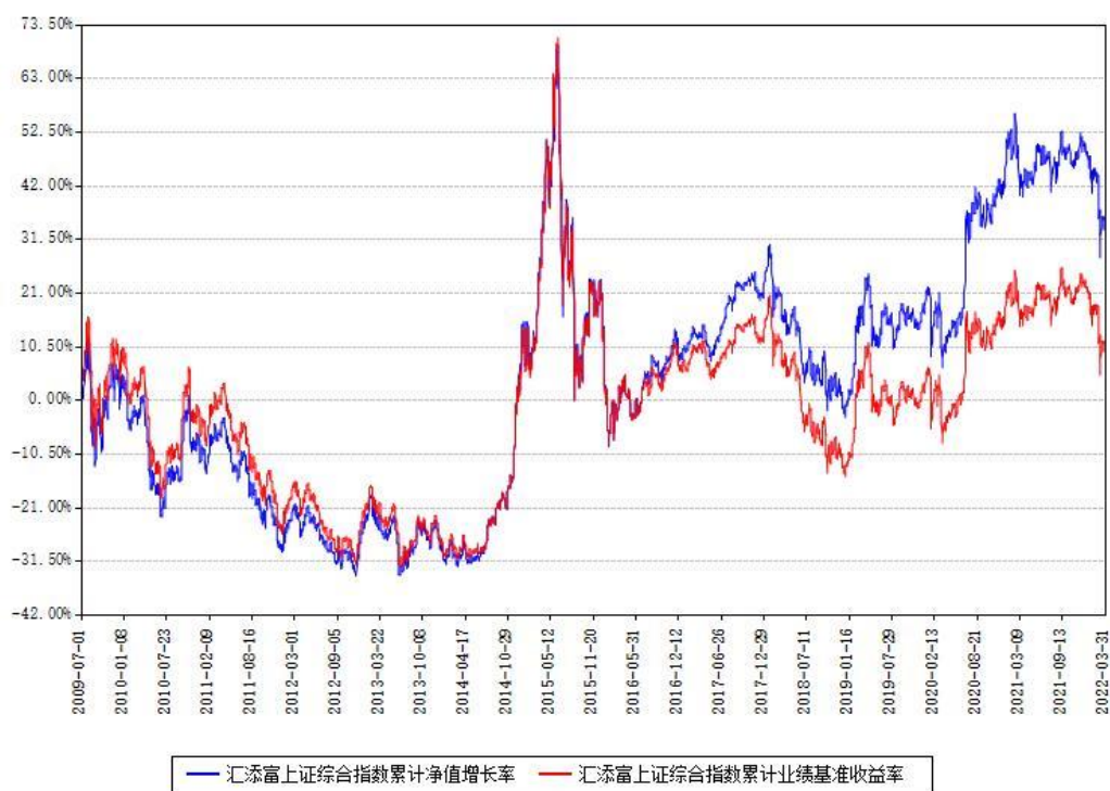
汇添富上证综合指数累计净值增长率与同期业绩基准收益率对比图

(二) 自基金合同生效以来基金累计净值增长率变动及其与同期业绩比较基准收益率变动的比较图