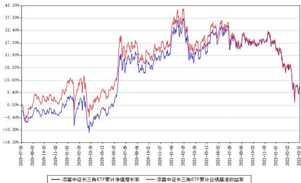
添富中证长三角ETF累计净值增长率与同期业绩基准收益率对比图

(二) 自基金合同生效以来基金累计净值增长率变动及其与同期业绩比较基准收益率变动的比较图