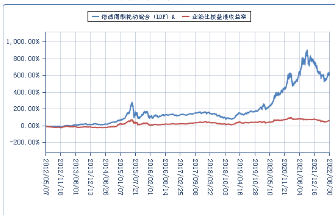
信诚周期轮动混合（LOF）C