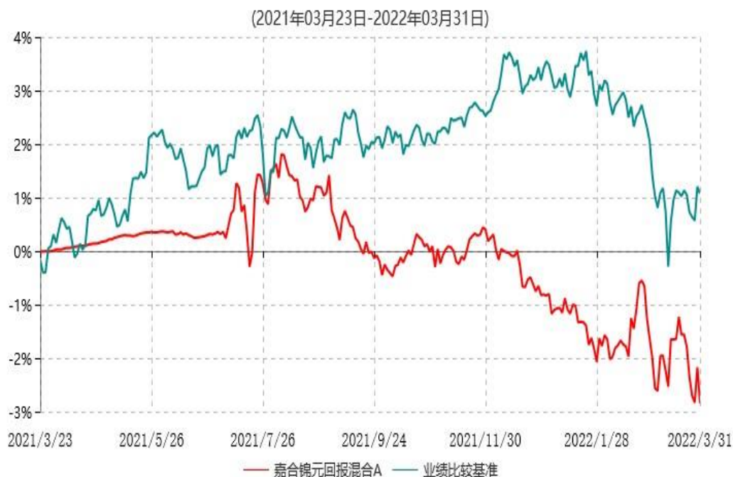
嘉合锦元回报混合A累计净值增长率与业绩比较基准收益率历史走势对比图

注：本基金基金合同于2021年03月23日生效，按照基金合同规定，本基金建仓期为基金合同生效之日起6个月。建仓期结束时，本基金的各项资产配置比例符合基金合同约定。