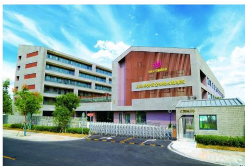
上海奉贤金海悦心颐养院

依托于悦心照护体系的完善和专业团队的壮大，“悦心·漫活欣成”、“悦心·安颐别业”、“悦心照护培训中心”三个产品线，互相支持、互为依托，形成齐头并进的发展态势。