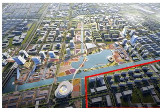
图：新浦江中心城市设计方案