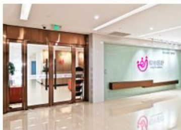
上海悦心综合门诊部