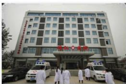
全椒同德爱心医院