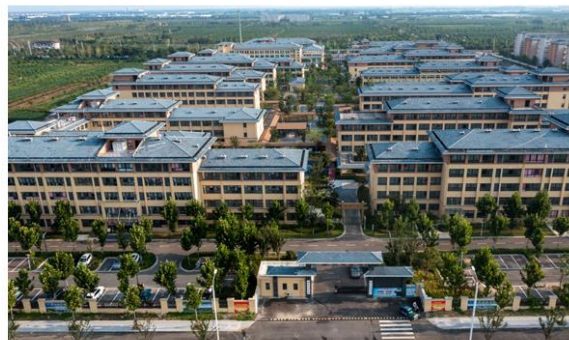
上海悦心泗洪康养中心