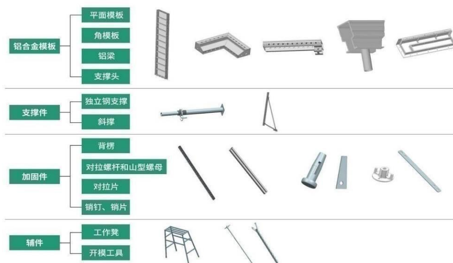
(图 1: 铝模系统产品图)