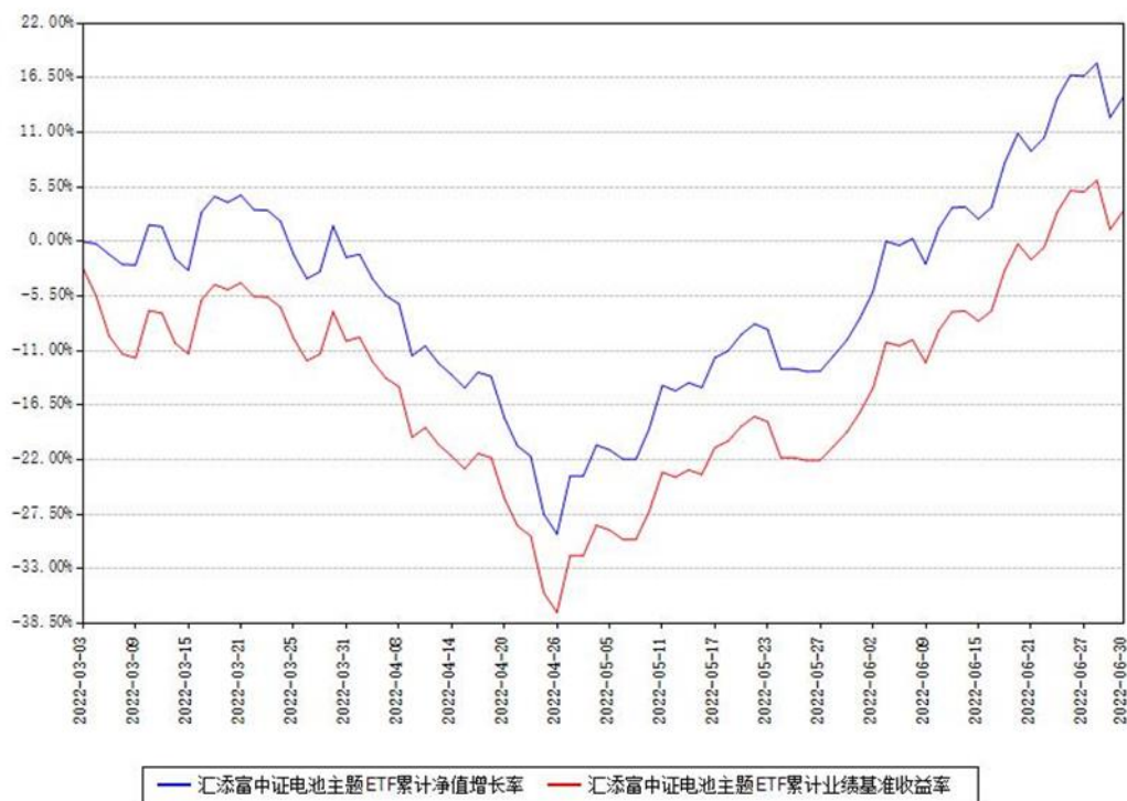
汇添富中证电池主题ETF累计净值增长率与同期业绩基准收益率对比图

(二) 自基金合同生效以来基金累计净值增长率变动及其与同期业绩比较基准收益率变动的比较图