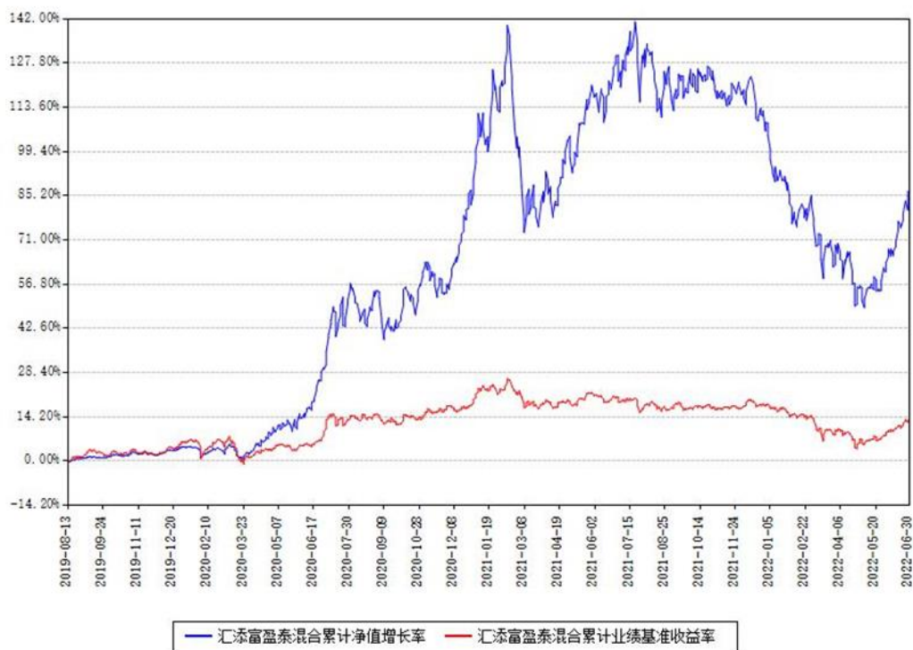
汇添富盈泰混合累计净值增长率与同期业绩基准收益率对比图

(二) 自基金合同生效以来基金累计净值增长率变动及其与同期业绩比较基准收益率变动的比较图