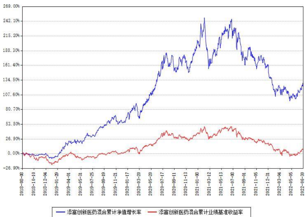
添富创新医药混合累计净值增长率与同期业绩基准收益率对比图