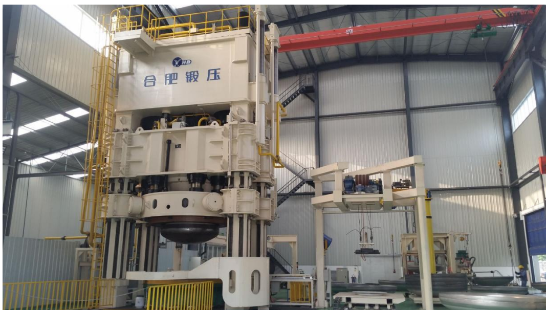
全自动封头液压机

公司研发的大型封头压机生产线广泛用于运输、石化领域的各类封头的生产成形，国内高端市场占有率第一。先后研发了浮动压边及控制技术、变压边力技术、可移动压边杆技术等该领域专用的核心技术，制造工艺方面突破了特大型单活塞缸生产制造难题，提高了封头压机对不同规格封头的适应性。结合变排量泵、伺服技术的应用进一步降低设备的能耗，实现了生产的高效节能。