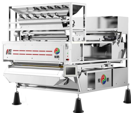
“鲲鹏”深度学习分选设备

报告期内，公司推出了多款新产品。其中，“鲲鹏”深度学习分选设备，产品性能可靠性得到提升，物料模型更大范围拓展，同时成本不断进行优化；新一代 RG 系列大米色选机，在传承 RG 产品优良特性的同时，推出大米全产线云互联智控加工技术，助力大米加工；在矿石色选机方面，为满足客户需求，从大颗粒、湿粒、干粒、粉料、小颗粒覆盖到盐类、金属矿等专用色选机；在茶叶色选机上，满足市场小门面商店的加工，公司推出小型茶叶色选机，推行“5 新升级”，达“5 星品质”高标准，利用红外光谱有效解决同色异物，弥补普通彩色光学系统，实现形选+色选+智选+质选+异物分选。