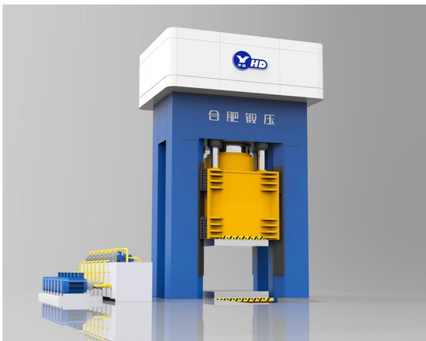
大吨位等温锻造液压机

航空航天、军工领域： 主要提供快锻及自由锻液压机、精密等温锻造压机、双动充液拉深液压机、多向模锻液压机、精密压药液压机等，用于飞机和航天器的核心零部件如飞机发动机叶片、制动片、起落架等以及航天整流器、燃料舱、高压异形接头等的生产。在技术层面上解决了航空航天、军工领域的部分卡脖子问题，设备性能参数达到和部分超越进口设备。