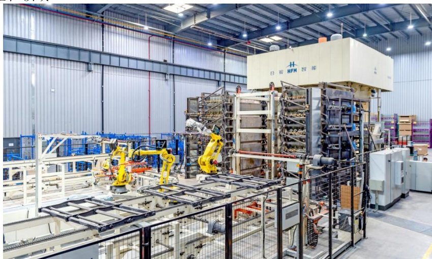
超高强度钢间接热成型设备整体集成线

公司拥有完善的技术研发体系，技术研发能力居行业领先地位。先后研发了超高速伺服位置闭环控制系统、液压机快速加/泄压控制系统、液压微速控制技术、压机平行度伺服控制技术、液压同步平衡控制技术、超高压增压及控制系统、高速液压机整体电液一体化控制技术、复合材料压机运动控制技术、层压机液压控制关键技术、多轴同步控制系统、远程运维与服务等一大批液压机领域的核心关键技术。完善的技术研发体系和一支经验丰富的技术团队，为新产品、新工艺、新技术的研发提供了有力支撑。近年来先后成功研制了高速冲压液压机及生产线、直接热成形成套生产线、间接热成形成套生产线、复合材料成套生产线、内高压成形成套生产线、整体液胀车桥生产线、层压机生产线、封头成形液压机成套生产线、精密等温锻造液压机、双动充液拉深液压机、多向模锻液压机、精密双向压药液压机、快锻液压机、海绵钛电极成型生产线等国内技术领先成套装备。设备主要应用于航空航天、军工、汽车、船舶、轨道交通、新材料、石化封头、高端家电等行业和领域。