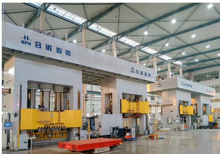
复合材料高速液压机生产线