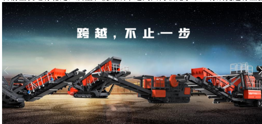
新一代移动式破碎筛分输送设备

报告期内，公司积极布局新产业领域，借助液压传动技术优势，立项开发新一代移动式破碎筛分输送设备，主要产品有履带式移动颚式破碎站、移动反击式破碎站、移动圆锥式破碎站、移动筛分站等重型装备。产品采用先进的设计理念与新技术的应用，完成设计开发、样机试制、定型并量产。目前整机运行稳定，质量和使用效率达到国内领先水平，有效促进行业技术进步。