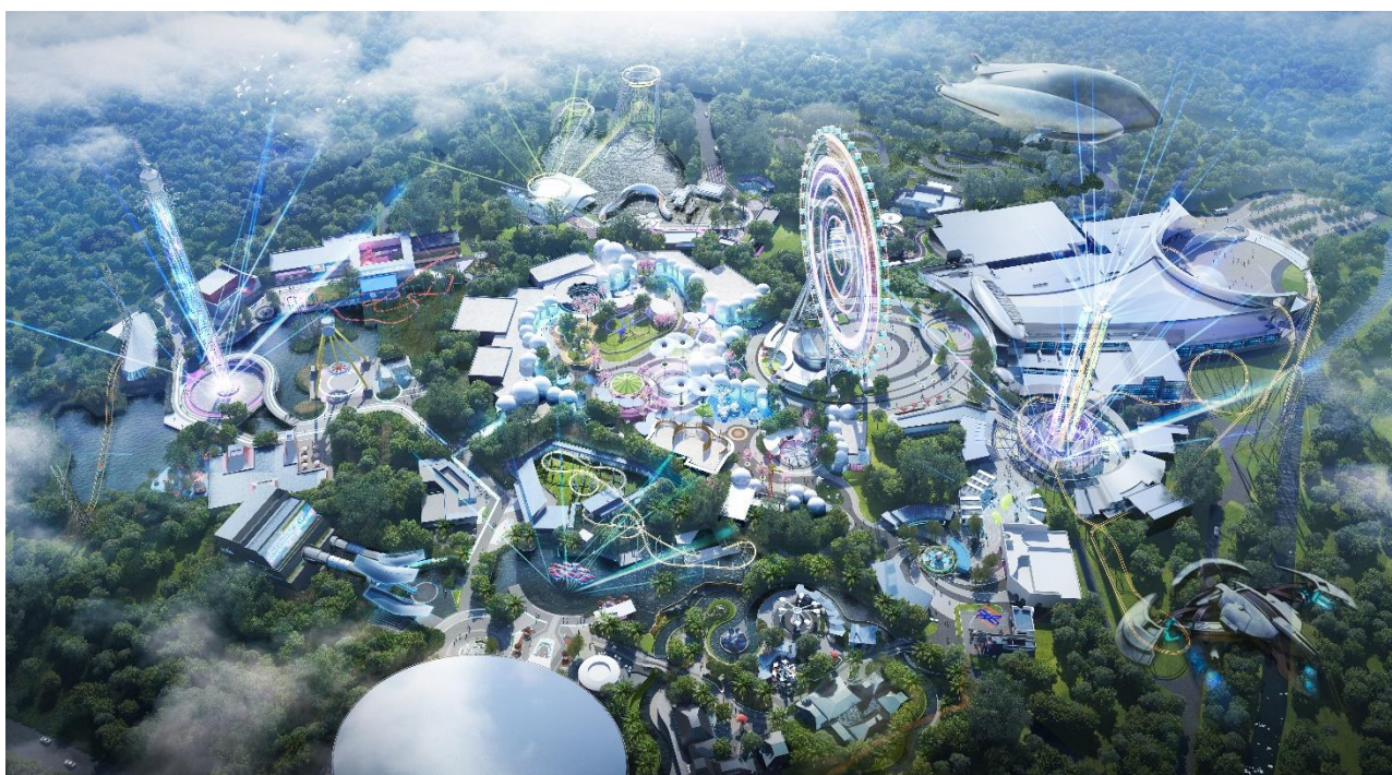
海盐融创室外主题乐园-设计项目

势，打造“策划咨询-规划设计-投融资服务-工程建设-招商运营”等五位一体的商业模式，为各地方政府、企业提供生态环境建设全领域、全过程、全要素的一揽子服务，业务类型覆盖旅游度假区、森林公园、生态湖泊、生态湿地、博览会展园、产业园区、会展中心、城市公园等，与各地政府、企业建立了长期良好的合作关系。公司屡获行业协会学会及政府机构颁发的项目奖项，如国家优质工程奖、中国风景园林学会优秀园林绿化工程奖大金奖、中国土木工程詹天佑奖优秀住宅小区金奖、国家重点环境保护实用技术及示范工程等国家级、省市级的重要奖项。