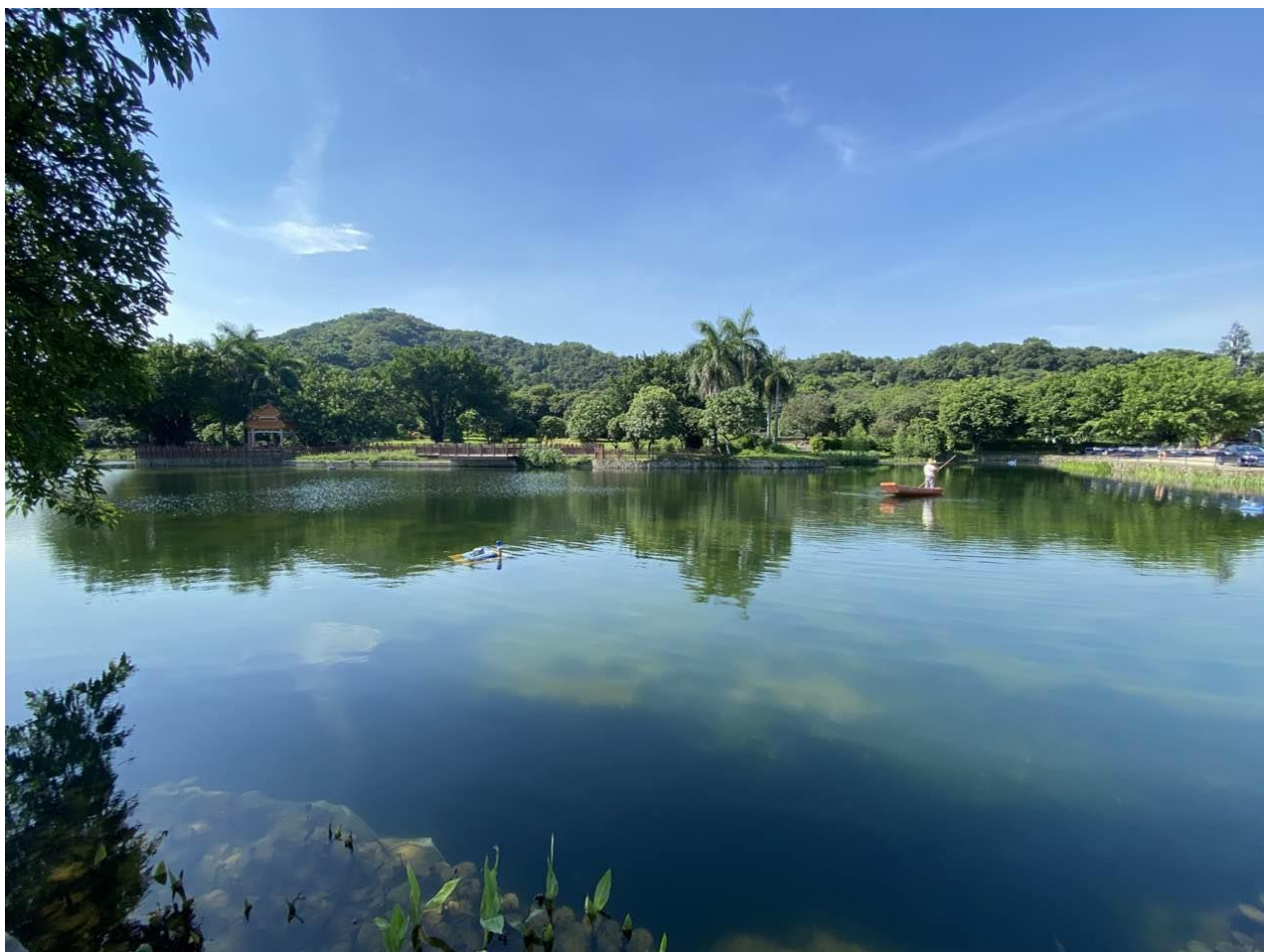
丹水坑项目现场图