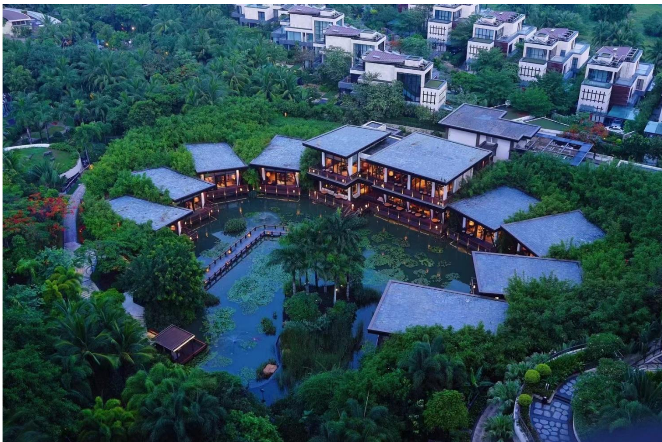
三亚海棠湾君悦酒店园林绿化养护

为理念，通过打造智慧环卫产业应用体系和环卫科技创新方案，引领环卫行业旗帜，助力公司内生发展与外延扩张相结合，完善产业链布局，是公司在城市运营领域的具体实践。