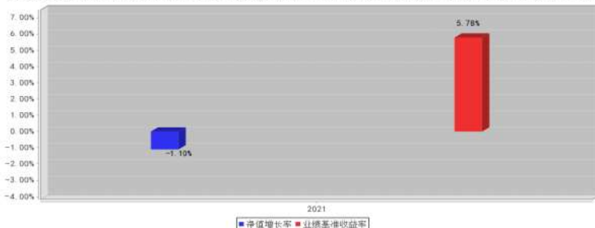
华泰柏瑞光伏ETF联接A基金每年净值增长率与同期业绩比较基准收益率的对比图(2021年12月31日)

注:业绩表现截止日期 2021 年 12 月 31 日。基金过往业绩不代表未来表现。