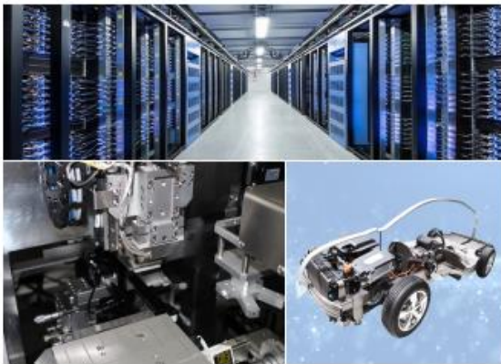
应用场景：节能、环保型设备以及医疗、安防、数据中心等设备的配套

公司的工业控制用变压器主要应用于节能、环保型设备以及医疗、安防、数据中心等设备的配套，产品包括：环形变压器、方形变压器、开关电源、移相变压器、干式变压器等。该类产品对电压调整率、阻抗电压、移相角度、电压精度、谐波、使用环境等方面有特殊要求，大部分属于定制类产品。工业控制用变压器产品的客户主要是国际、国内一流的工业控制设备制造商，如日立、明电舍、博世、罗克韦尔、施耐德等。