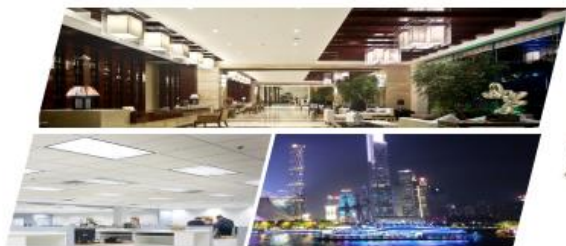
应用场景：商业、家居及户外照明