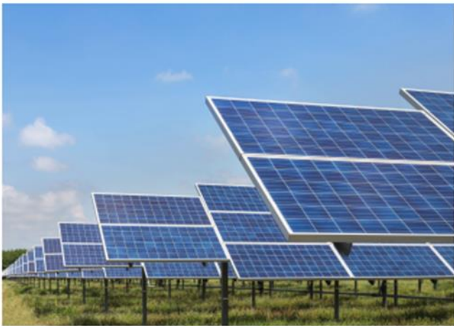
应用场景：光伏发电