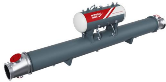
卧式布置余热锅炉