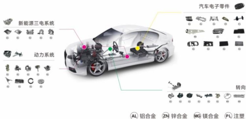
公司精密压铸产品在汽车的应用领域示意图