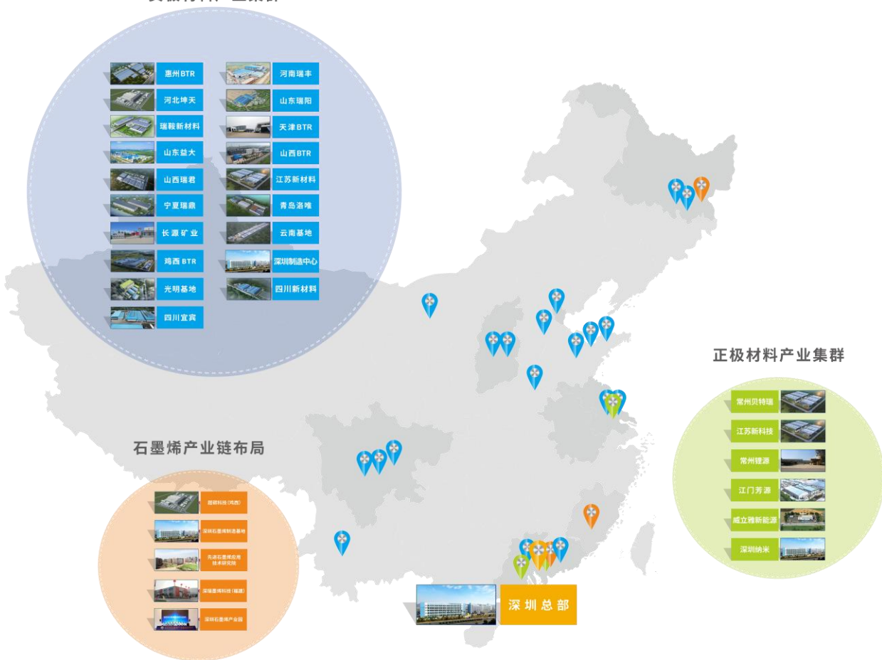
负极材料产业集群

贝特瑞新材料集团股份有限公司 BTR New Material Group Co., Ltd