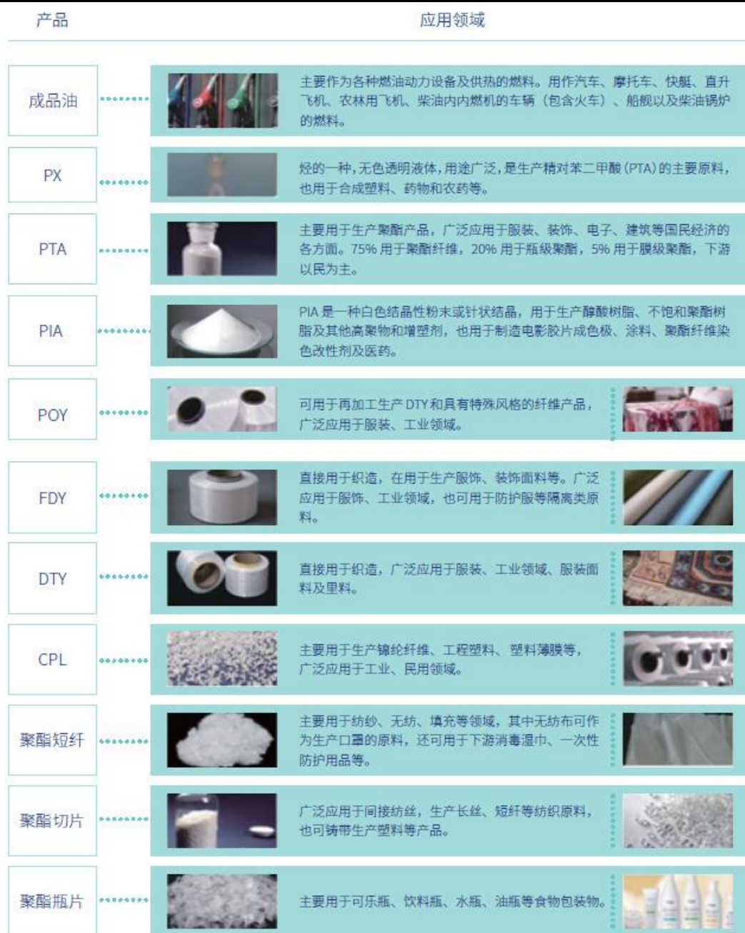
图 2 公司主要产品特点及应用领域

纺布可用于消毒湿巾等健康领域；聚酯瓶片广泛用于食品包装及医用物资生产等领域，瓶级 PET 在饮料、乳制、食用油、调味品等民生行业的需求量保持稳定增长，在酒类、日化、电子产品、医用产品等新兴应用领域的占有率快速提升。