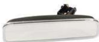
无边框 EC 内视镜