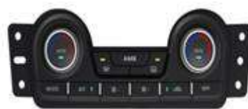
多温区式全自动空调控制器