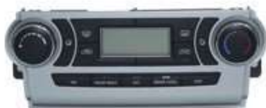
电动电子式空调控制器