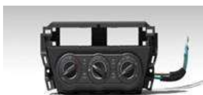
手动机械式空调控制器