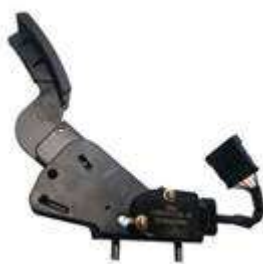
踏板式电子油门踏板总成