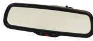
双球头 EC 内视镜