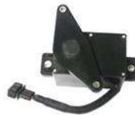
手动式电子油门踏板总成