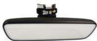
窄边框 EC 内视镜