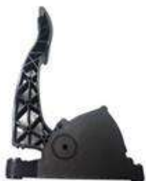
悬挂式电子油门踏板总成