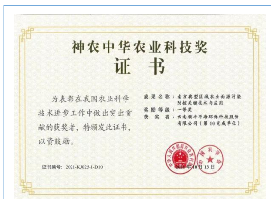
经农业农村部表彰决定，由公司与中国农业科学院、上海交通大学等产学研合作单位共同研发的“南方典型区域农业面源污染防治关键技术与应用”成果荣获“神农中华农业科技奖”一等奖。