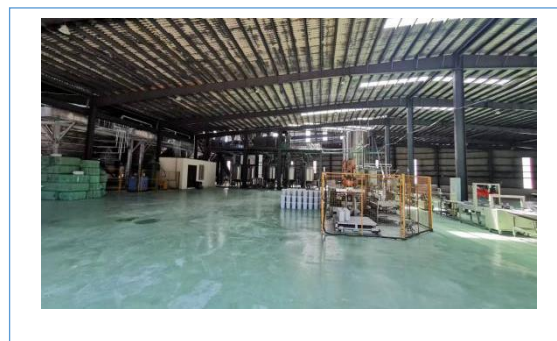
云南顺丰洱海环保科技股份有限公司投资新建的年产10万吨的全新智能化液体肥生产线正式投入试生产。