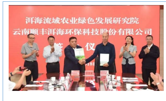
洱海流域农业绿色发展研究院与公司签署科研提升技术合作协议。