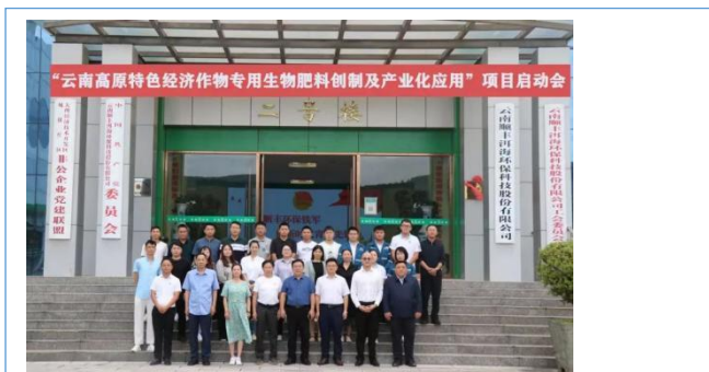
由云南农业大学主持的云南省重大科技专项“云南高原特色经济作物专用生物肥料创制及产业化应用”项目启动会在公司顺利召开。