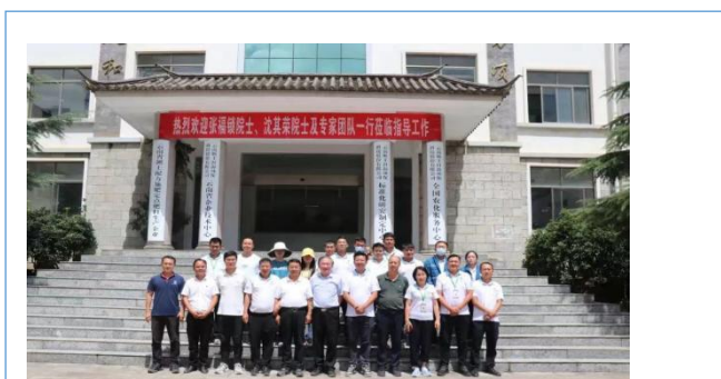
张福锁院士、沈其荣院士一行莅临云南顺丰洱海环保科技股份有限公司指导工艺提升和产品研发工作。