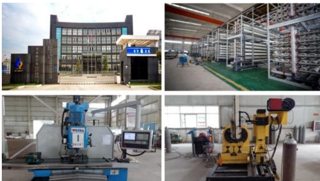
倍杰特生产制造基地