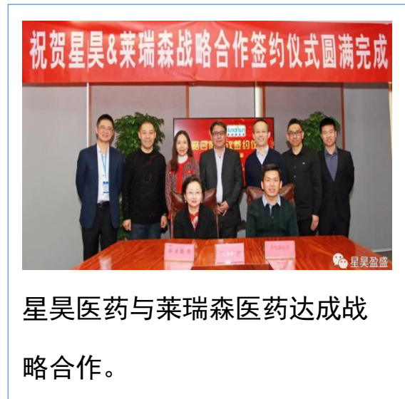
星昊医药与莱瑞森医药达成战略合作。

2022年6月16日北京星昊收到北京证券交易所出具的公司向不特定合格投资者首次公开发行股票并上市的申请《受理通知书》。 广东星昊于2022年3月10日至18日接受了波兰国家药品监督检查局（Chief Pharmaceutical Inspector）对广东星昊终端灭菌小容量注射剂生产线的GMP检查。