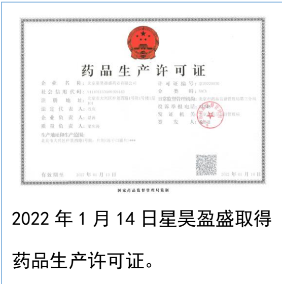
2022年1月14日星昊盈盛取得药品生产许可证。