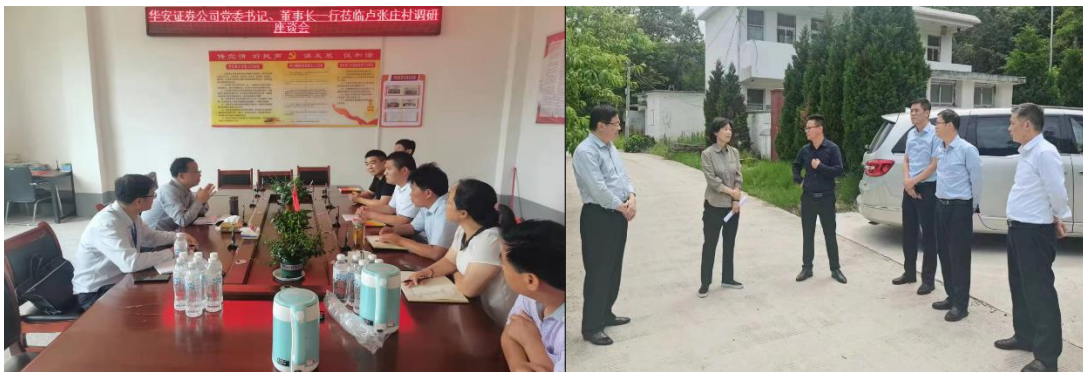
（公司领导带队赴帮扶乡村调研）

公司党委深刻认识开展结对帮扶工作的重要意义，把乡村振兴工作作为党委会议重要议事日程进行安排部署，公司领导班子成员深入一线，召开座谈会，听取乡村振兴汇报，部署工作任务，立足实际，精准施策，统筹推进产业振兴、民生振兴、教育振兴、金融振兴等各项工作。成立了由公司党委主要负责同志任组长、班子成员任副组长的结对帮扶工作领导小组，把结对帮扶工作纳入年度重点任务，纳入对相关部门年度考核的重要内容，召开结对帮扶调度会，听取各责任部门汇报，研究部署工作任务，扎实推动各项任务落实落地，充分体现国有金融企业的政治担当和柱石作用。