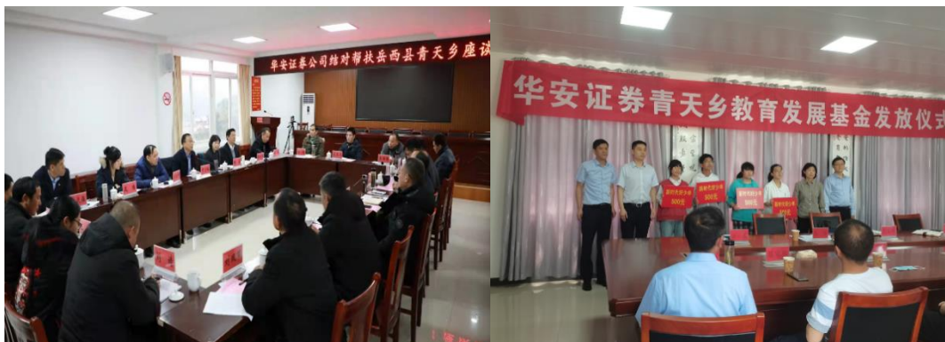
（公司在帮扶县成立教育发展专项资金）

公司积极响应中国证监会、中国证券业协会号召，深化与原国家级贫困县岳西县、宿松县、霍邱县、临泉县、利辛县等“一司一县”结对帮扶工作，完善帮扶机制，形成工作合力，围绕党建引领、人才支援、产业帮扶、就业帮扶、消费帮扶等六个方面，细化量化实化帮扶举措。公司制定了结对帮扶岳西县青天乡实施方案、工作计划，紧扣 12 项帮扶任务 28 个帮扶项目，逐个调度，逐一推进，实行清单化、闭环式管理，确保帮扶项目落地见效。目前，教育发展、产业扶持、大病救助三个专项资金已经设立，消费帮扶、产业帮扶、基础设施等具体帮扶项目正按计划推进。