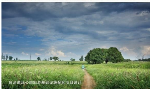
良渚遗址公园旅游基础设施配套项目设计