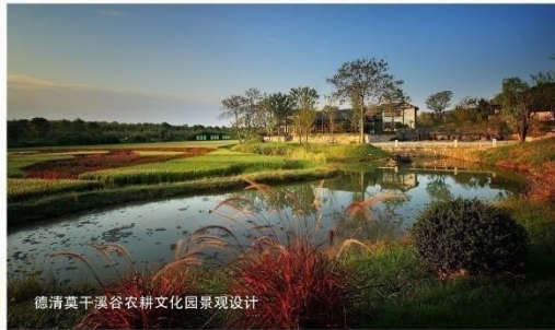
德清莫干溪谷农耕文化园景观设计

Hangzhou Landscape Architecture Design Institute Co.,Ltd.