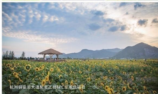
杭州铜鉴湖大道配套工程EPC总承包项目

Hangzhou Landscape Architecture Design Institute Co.,Ltd.