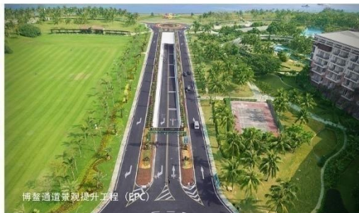
博鳌通道景观提升工程（EPC）