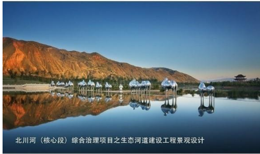
北川河（核心段）综合治理项目之生态河道建设工程景观设计