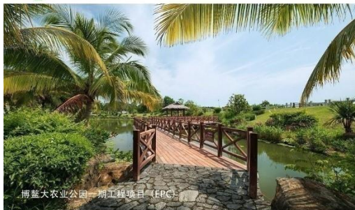
博鳌大农业公园一期工程项目（EPC）