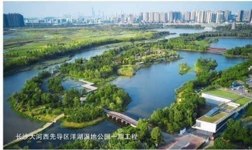
长沙大河西先导区洋湖湿地公园一期工程