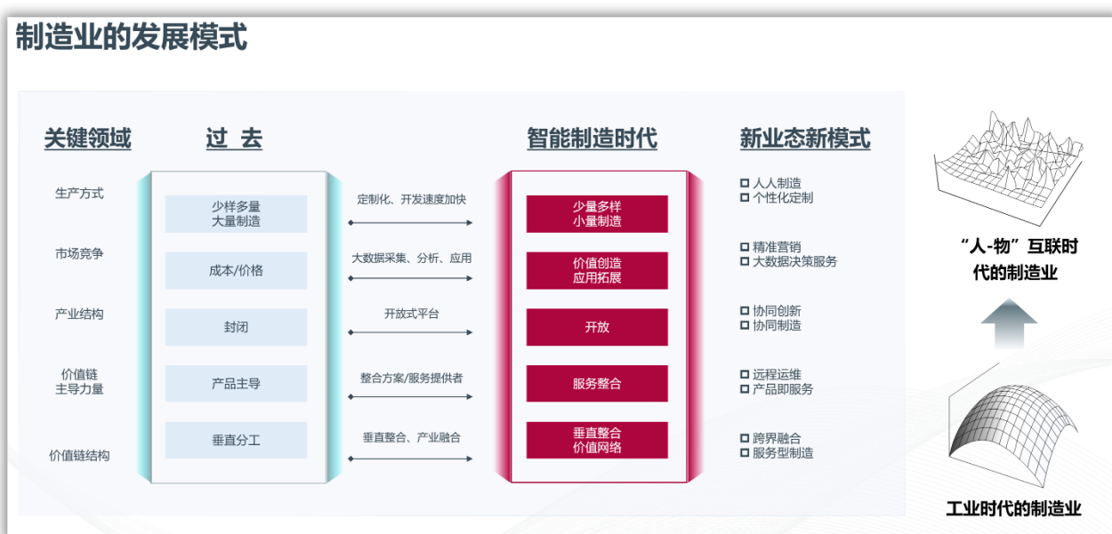
中国制造业的发展模式演变

智能制造是利用物联网、大数据、云计算、云储存等技术，将用户、供应商、智能工厂紧密联系起来，在制造过程中具有信息自感知、自决策、自执行等功能的先进制造过程、系统和模式的总称，是信息技术、智能技术与装备制造技术的深度融合与集成。智能制造的本质，是软件化的工业技术，软件控制生产数据的流动，解决复杂产品的不确定性，其中工业管理软件是制造业数字化的核心。