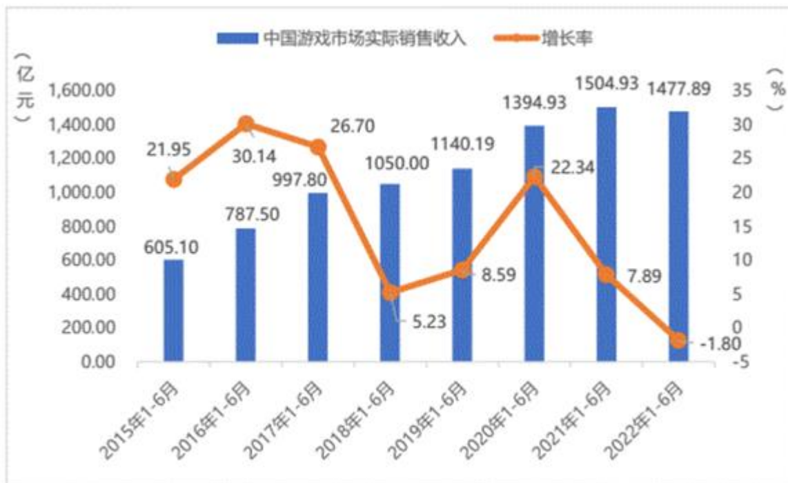
图 1 中国市场实际销售收入及增长率

同比下降了 0.13%。主要原因在于疫情导致用户收入减少，消费意愿降低，游戏企业经营成本持续增加等。用户规模下降趋势表明，游戏产业的“人口红利”基本消失，行业或已进入存量竞争时代。同期，自主研发网络游戏国内市场实际销售收入 1245.82 亿元，同比下降 4.25%。