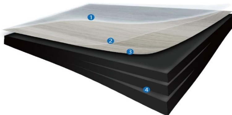
悬浮地板产品结构图