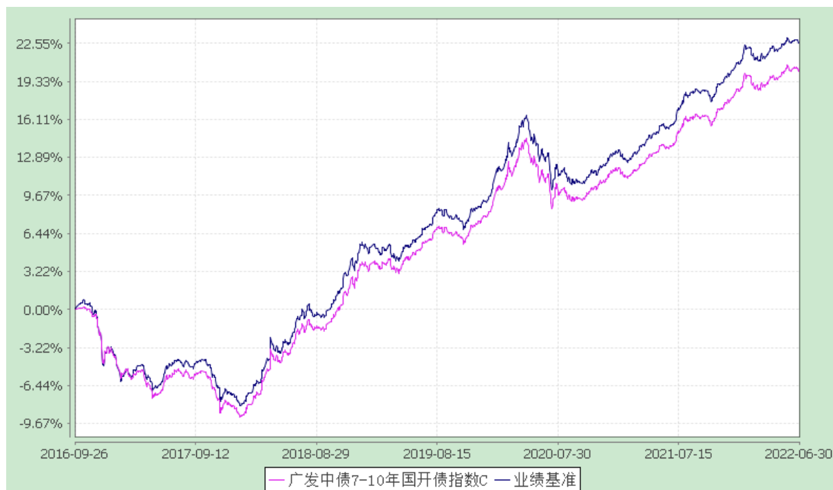
广发中债 7-10 年期国开债指数 E