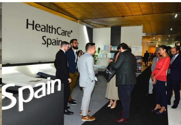
梦百合参加西班牙 Yecla 家具展 (FMY)