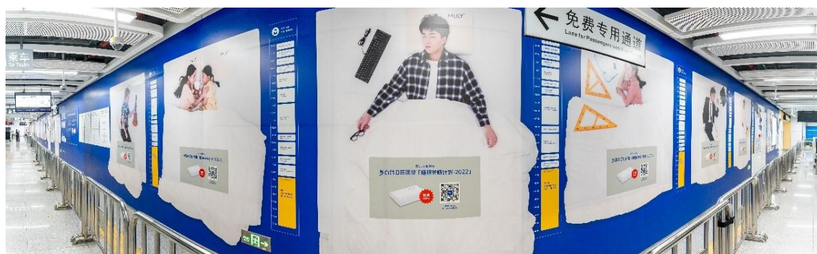
梦百合 0 压床垫睡眠关怀计划——北京海淀黄庄地铁站品牌墙

品牌传播方面，MLILY 梦百合品牌战略清晰定义了自己的“0 压”主张及“照顾者”品牌人设，以“致力于提升人类的深度睡眠”为使命，聚焦家居和睡眠产业，关注国人压力与睡眠问题。基于“梦百合 0 压床垫，压力小，睡得好”的产品定位和传播创意，进行多渠道品牌传播，持续提升品牌认知度、知名度、美誉度。报告期内，MLILY 梦百合在全国 176 个高铁站、航空杂志、家居商场等投放广告，渗透更广泛的人群，提高品牌知名度；从内容和创意出发，利用小红书、抖音、B 站等平台和品牌用户进行强效的社交互动和沟通，持续输出品牌文化理念，积累品牌核心粉丝群体，沉淀 MLILY 梦百合品牌资产；全网开展产品种草推广，提升床垫品类搜索曝光及点击量，建立和提升品牌产品在消费者侧的心智，有效实现品牌产品完成从购买意愿到购买行为的完整闭环；全面启动具有 MLILY 梦百合品牌特色的试睡项目，强化产品体验，立体赋能线下门店，打造 MLILY 梦百合触觉符号；贯彻打造 MLILY 梦百合品牌营销日历，积极开展 MLILY 梦百合“321 全民试睡节第六季”、“51 0 压劳动节”、“618 老倪推荐日第三季”等经典 IP 活动，实现品牌推广与终端销售的目的；为引发国人对睡眠的关注，发布“梦百合 0 压床垫睡眠关怀计划”，选择全国 170 多个高铁站，通过百城千屏，激活品牌长效实力。