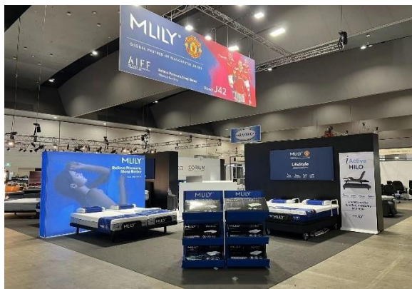
梦百合参加澳大利亚国际家具展 (AIEF)

国际市场：公司持续进行品牌管理，建立全球统一的品牌形象；利用具有全球影响力的曼联 IP 资源，开展全球品牌推广；在国际睡眠日期间，联合德国、塞尔维亚等国同步开展 MLILY 梦百合“321 全民试睡节”活动，进一步深化品牌全球联动；公司重视海外社交媒体运营，新开通了公司在西班牙、意大利、德国 3 个国家的社媒账号，持续运营塞尔维亚、英国、美国等国的社交媒体账号，并邀请当地达人为品牌代言，和海外消费者互动，增加用户粘性；积极参加全球知名的家居展会，并在英国伯明翰 January 家居展上赢得了主办方颁发的“最佳展台”奖牌，为 MLILY 梦百合在全球内的市场开拓和品牌推广奠定基石。