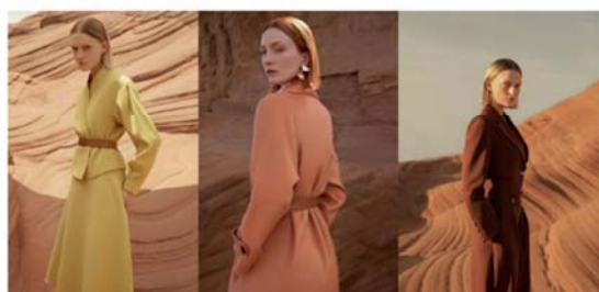
ANMANI 恩曼琳秋季形象大片