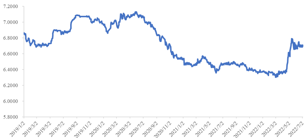
2019年至2022年6月美元兑人民币汇率走势