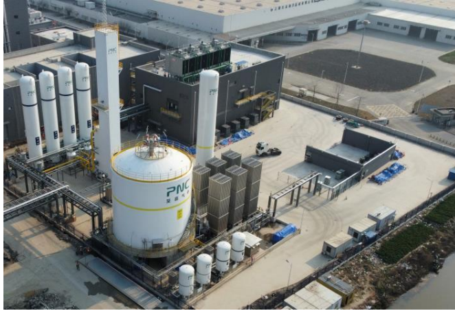
半导体级大宗气体工厂