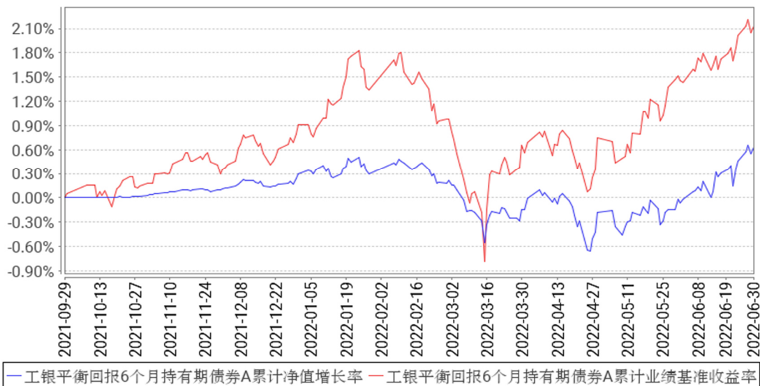
工银平衡回报6个月持有期债券A累计净值增长率与同期业绩比较基准收益率的历史走势对比图