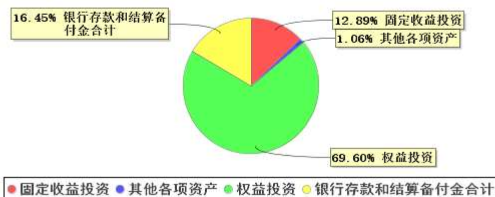
投资组合资产配置图表(2022年6月30日)