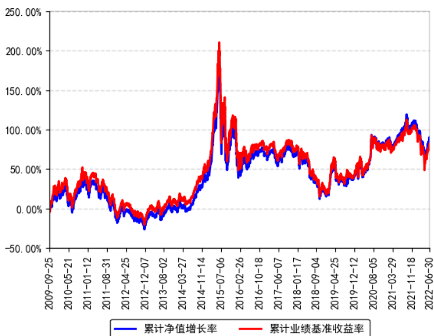
南方中证500ETF联接（LOF）A累计净值增长率与同期业绩比较基准收益率的历史走势对比图