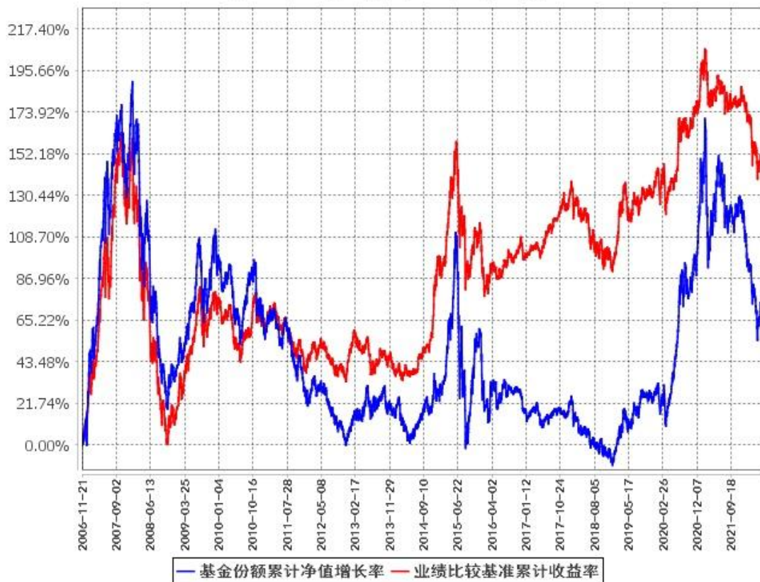
基金份额累计净值增长率与同期业绩比较基准收益率的历史走势对比图 (2006年11月21日至2022年6月30日)

注：1、根据本基金的基金合同第十一部分“基金投资”中“八、投资组合限制”的规定，本基金自2006年11月21日合同生效之日起六个月内为建仓期，建仓期结束时各项资产配置比例符合基金合同约定。