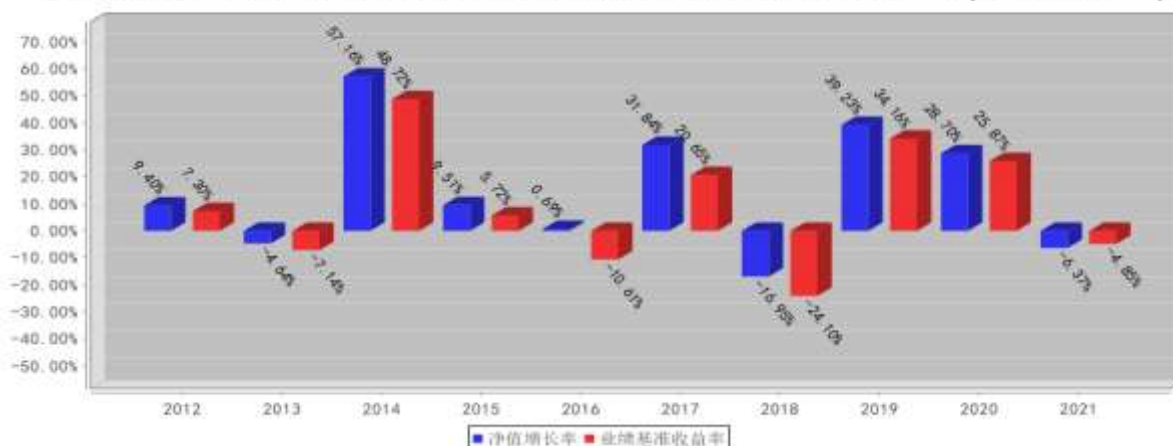
兴全沪深300指数(LOF)A基金每年净值增长率与同期业绩比较基准收益率的对比图(2021年12月31日)