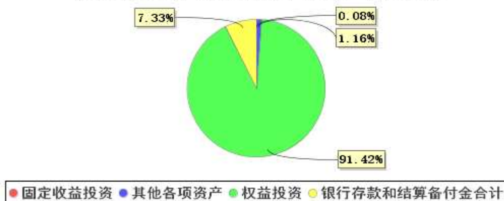
投资组合资产配置图表(2022年6月30日)