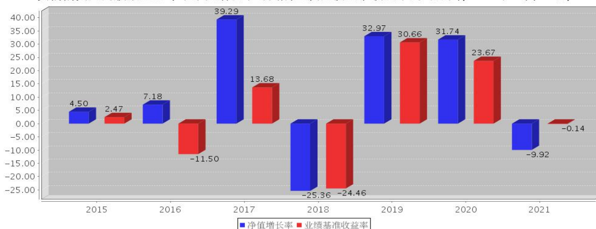
安信消费医药股票基金每年净值增长率与同期业绩比较基准收益率的对比图(2021年12月31日)

注: 基金合同生效当年期间的相关数据按实际存续期计算。基金的过往业绩并不代表其未来表现。