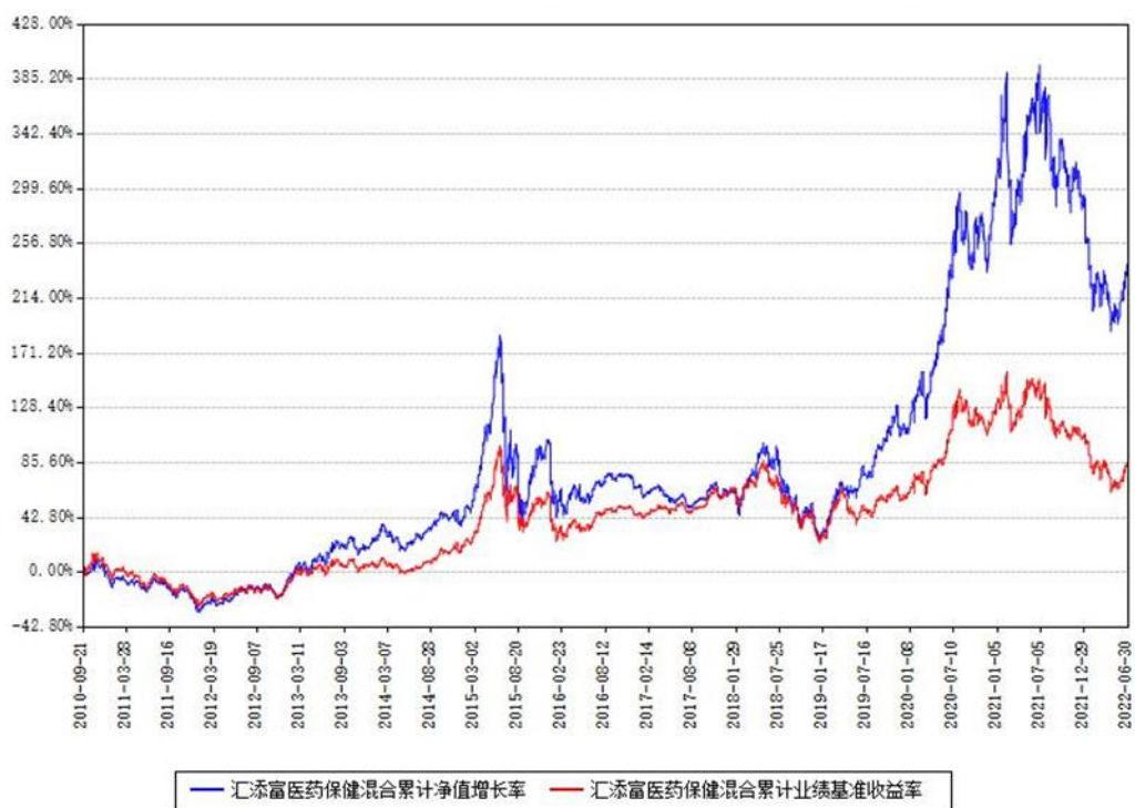
汇添富医药保健混合累计净值增长率与同期业绩基准收益率对比图