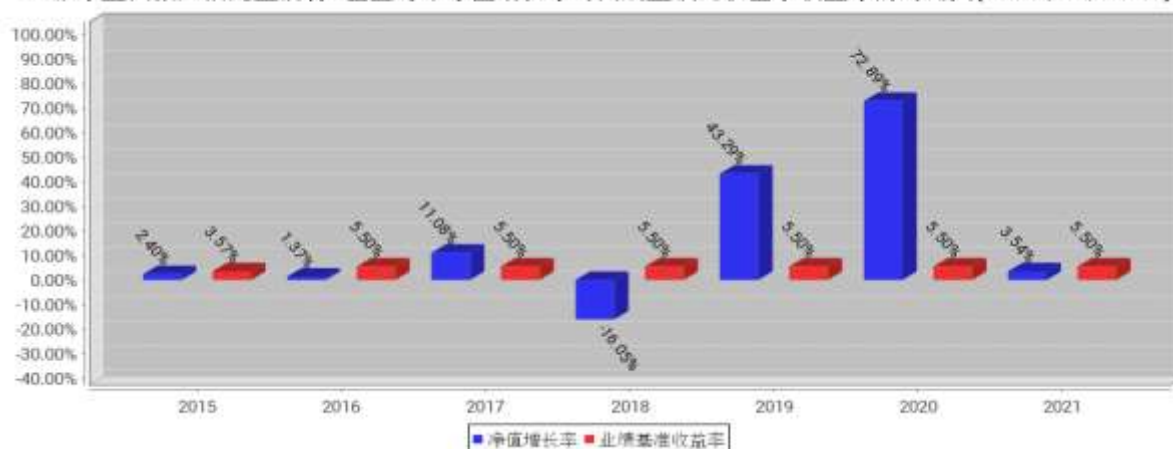
工银丰盈回报灵活配置混合A基金每年净值增长率与同期业绩比较基准收益率的对比图(2021年12月31日)

注:1、本基金基金合同于2015年5月22日生效。合同生效当年不满完整自然年度的，按实际期限计算净值增长率。